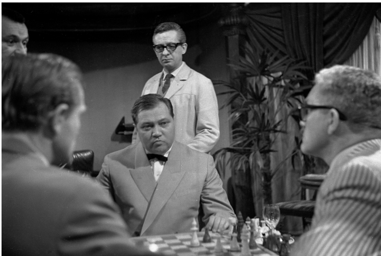
Šach mat

Respekt stan vás provede sedmdesátiletou historií FAMU, nabídne pohled filmových publicistů na současný televizní seriál, tradiční debatu s redaktory Respektu a poskytne vám i návod, jak získat a použít hudbu ve filmu či videoklipu.