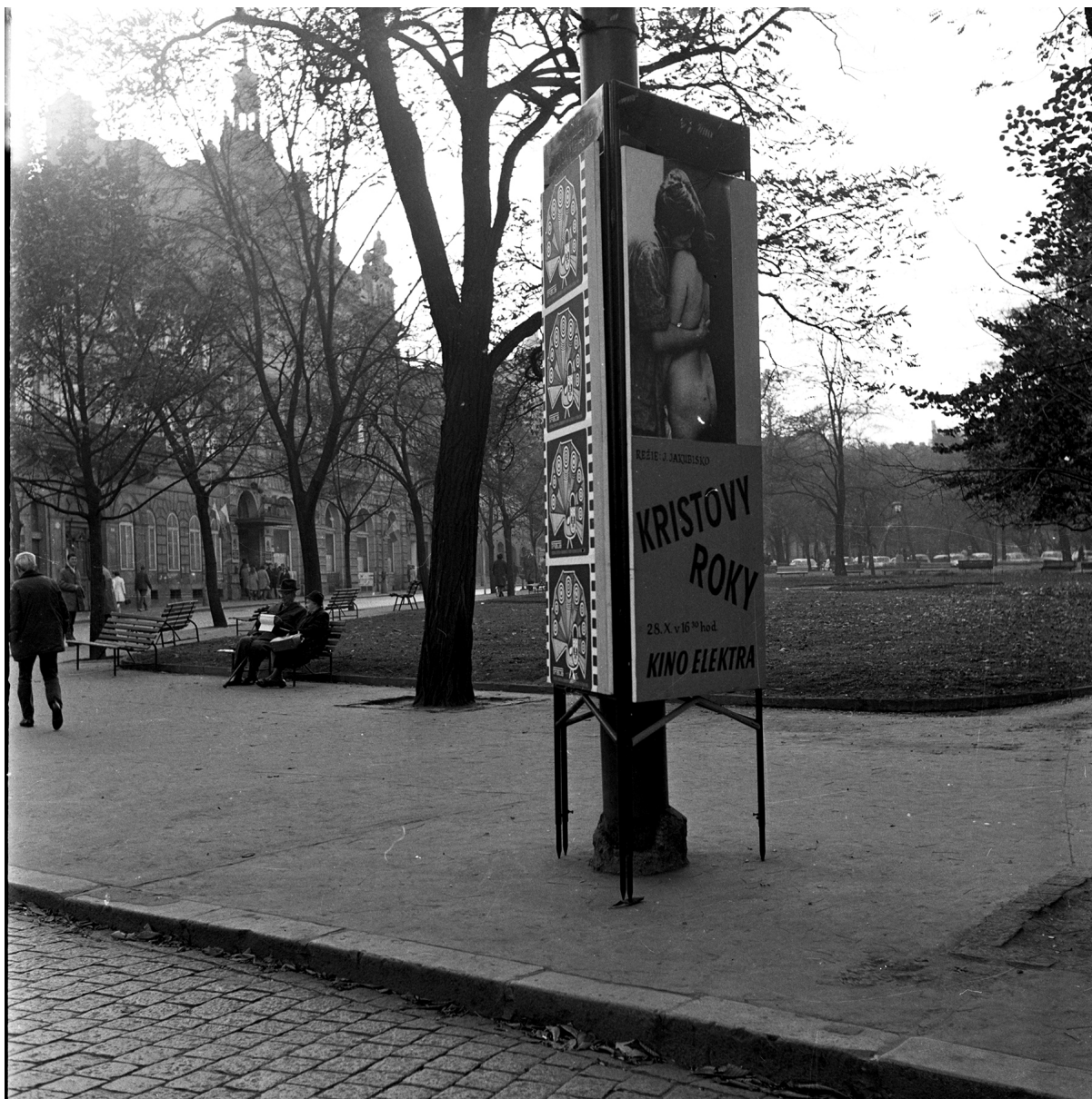
Poblíž nynějšího místa konání festivalu, Měšťanské besedy