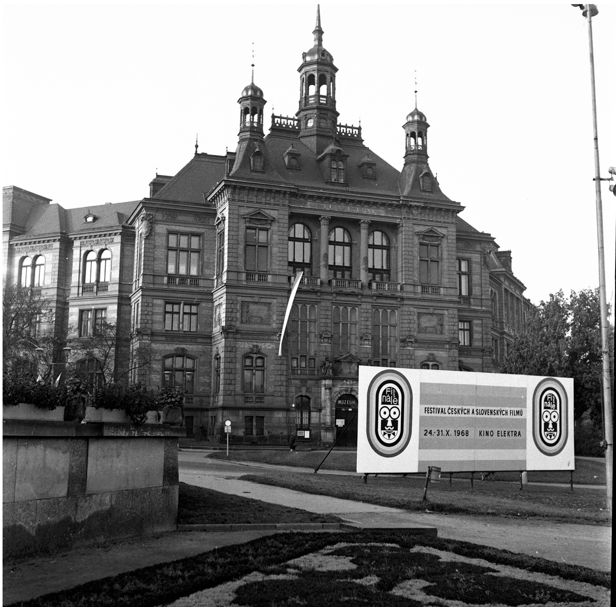
Poutač na první ročník Finále před Západočeským muzeem v Plzni