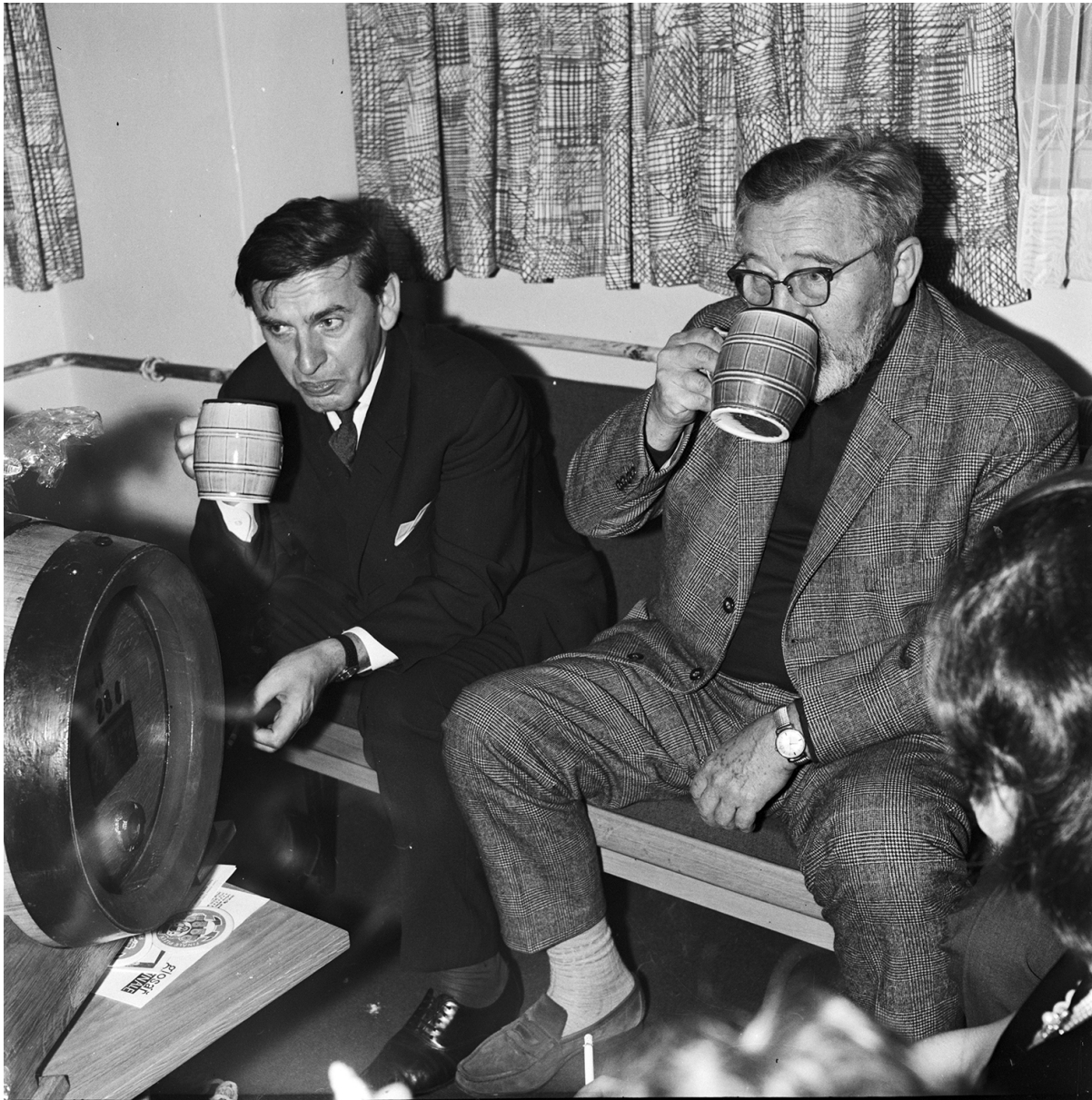
Jozef Kroner a Jan Werich