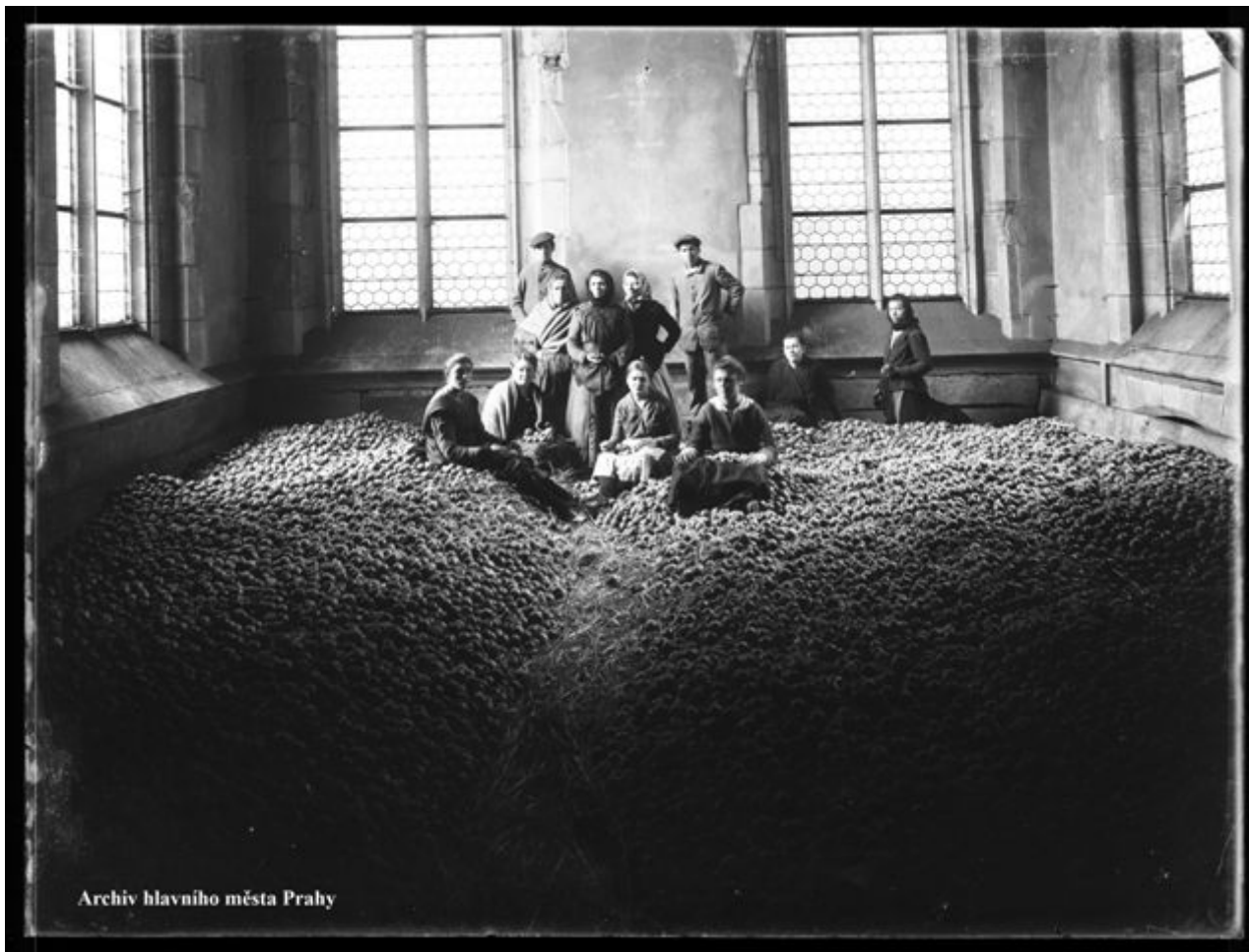
Pohled na zásoby jablek v místnosti obecní zásobárny v Praze, kol. 1915

Na profesionálních fotografiích Jana Kříženeckého, od kterých bychom mohli očekávat neosobnost a účelovost, leckdy vystupuje do popředí specifická nálada, humor či jiný obrazový ruch. [12] Jednoznačně jsou podstatnou součástí Kříženeckého tvůrčí práce. Soubor jeho skleněných negativů je uložen v Archivu hlavního města Prahy. Jeho fotografie byly též reprodukovány v několika publikacích a v roce 1981 o nich vznikl krátký filmový dokument Praha Jana Kříženeckého (r. Miro Bernat, 1981).