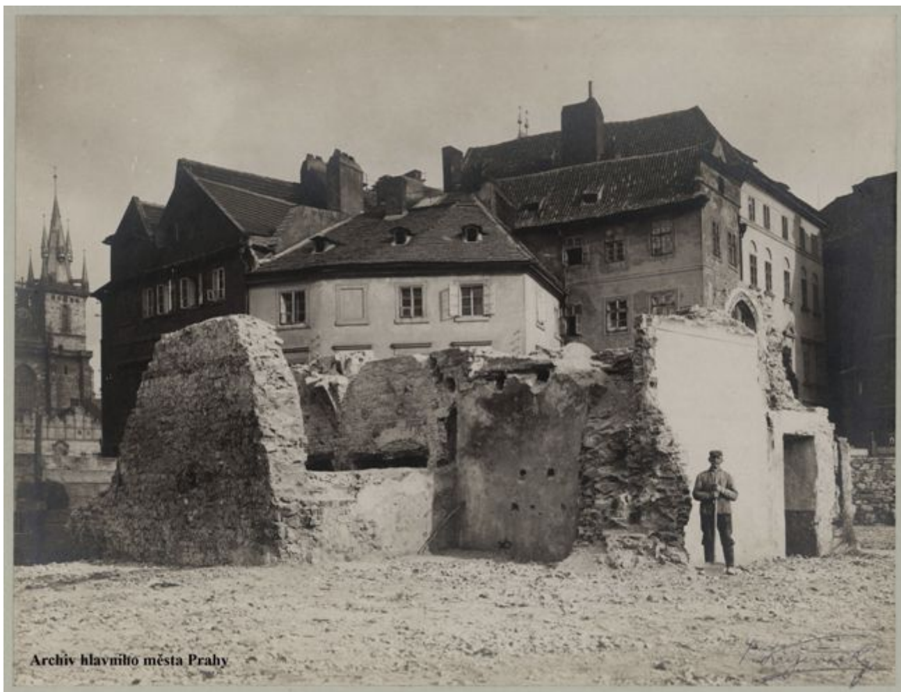
Pohled na zbytky románského zdiva nalezeného při bourání domu čp. 16 v ulici U radnice na Starém Městě, 3. 4. 1909