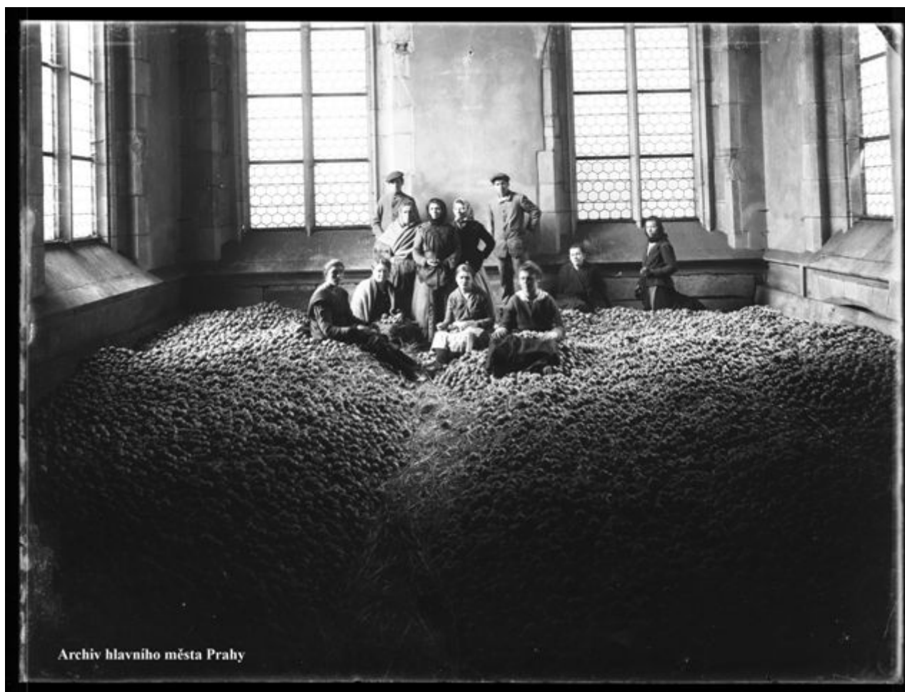
Pohled na zásoby jablek v místnosti obecní zásobárny v Praze, kol. 1915

Na profesionálních fotografiích Jana Kříženeckého, od kterých bychom mohli očekávat neosobnost a účelovost, leckdy vystupuje do popředí specifická nálada, humor či jiný obrazový ruch. [12] Jednoznačně jsou podstatnou součástí Kříženeckého tvůrčí práce. Soubor jeho skleněných negativů je uložen v Archivu hlavního města Prahy. Jeho fotografie byly též reprodukovány v několika publikacích a v roce 1981 o nich vznikl krátký filmový dokument Praha Jana Kříženeckého (r. Miro Bernat, 1981).