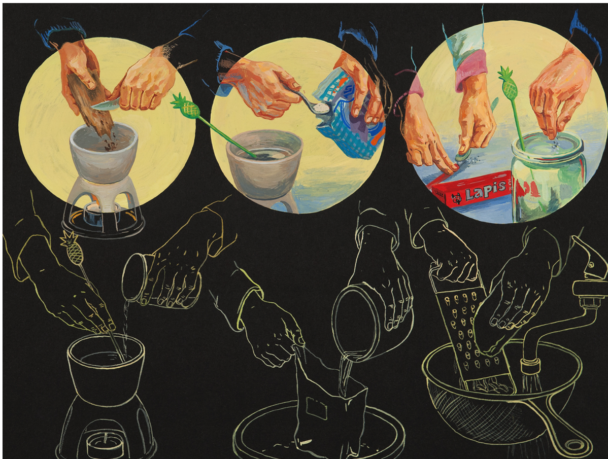
Ilustrace © Vojta Horálek

se trojice hlavních hrdinů v knize setká, tedy Jan Evangelista Purkyně, Alexander Hackenschmied, Karel Teige, Václav Tille a Jan Kučera. Nakonec je čtenáři doporučena rozšiřující literatura.