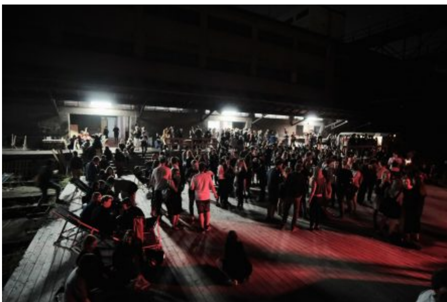
Zahájení sezóny na 1435mm/Nákladovém nádraží Žižkov

S: Doprovodný program se často zabývá i lidskoprávní tematikou. Na nádraží byla do poloviny června k vidění výstava fotografií z války na Ukrajině, kterou jsme pořádali ve spolupráci s ukrajinskou ambasádou. Nyní je na perónu nainstalována výstava o výstavbě a budoucnosti Žižkova. Obecně ale usilujeme o apolitičnost.